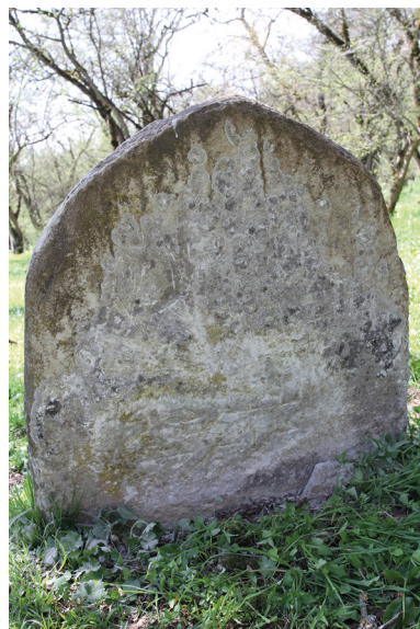
Рис. 6. Вертикальная стела № 7 кладбища Местте.

Формой верха, трапециевидностью, наличием выделенного центрального вертикального поля, центральной розетки стела напоминает памятники кладбища уцмиев в Кала-Корейше и в целом надгробия уцмийского стиля в ранней их вариации [5, с. 87–92]. При сравнении с известными образцами бросается в глаза грубость декора хада-