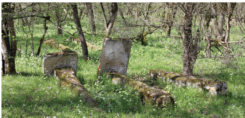
Рис. 1. Общий вид надмогильных комплексов кладбища Местте.

Название Местте происходит от слова «мечеть», которое в локальном наречии звучит как «мастик». Здесь есть остатки мечети, которая была построена из обожженного кирпича. Ориентация мечети строго на юг и размеры кирпича, получившего в археологии определение «домонгольского времени», датируют мечеть, хоть и в обширных пределах. Вокруг мечети виднеются следы крепостных стен из того же кирпича и квадратной в сечении башни, которая возвышалась в одном из углов. В районе несколько мест концентрации горизонтальных надгробий, но наибольший интерес представляет группа из шести захоронений, расположенных к востоку от остатков мечети (между мечетью и башней) (рис. 1). Они обустроены симметрично в два ряда.