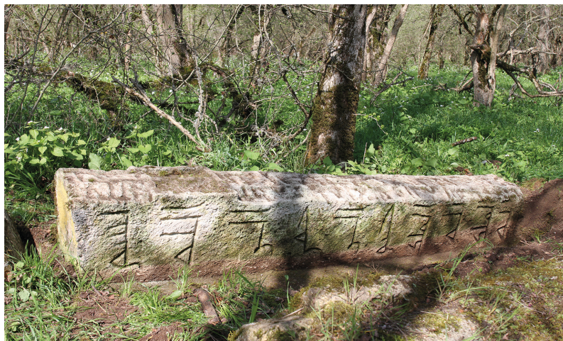
Рис. 4. Горизонтальное надгробие № 4 кладбища Местте.

Вертикальная стела (ш. 65 см), расколота на несколько частей, лежит рядом с горизонтальной частью надмогильного комплекса (рис. 5). Стела имеет прямоугольную форму. В ее центр помещено врезное поле, по форме идентичное аналогичному элементу декора стелы надмогильного комплекса № 2.