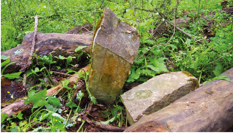
Рис. 9. Столбовидная стела 1463/64 г.

Дата соответствует 1463/64 г. Имя Халик написано с орфографической ошибкой. Также следует отметить, что датировка цифрами редко встречается на памятниках XV в.