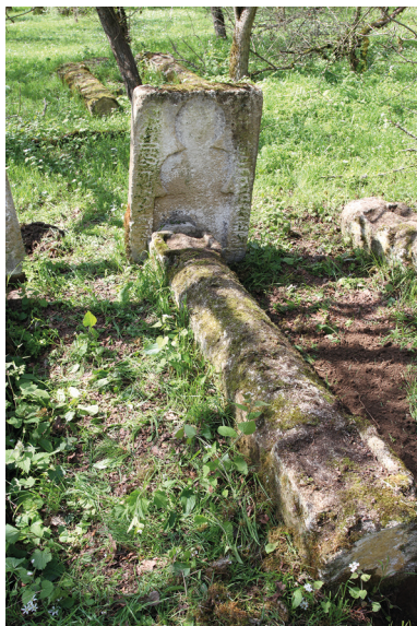
Рис. 2. Надмогильный комплекс № 2 кладбища Местте.

Часть из них — горизонтальные надгробия, часть — надмогильные комплексы из двух элементов — горизонтального памятника и установленной у изголовья вертикальной стелы.