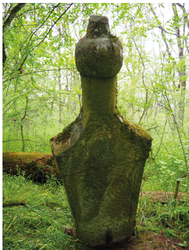
Рис. 12. Вертикальная стела антропоморфной формы 1640/41 г.