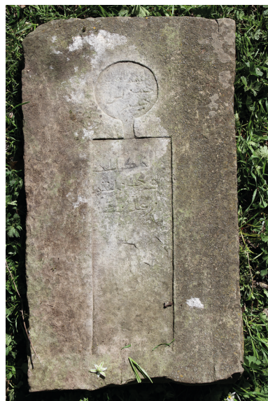
Рис. 7. Вертикальная стела № 8 кладбища Местте.