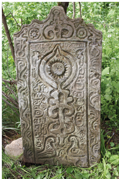
Рис. 8. Вертикальная стела с фигурным стрелчатым верхом 1352/53 г.

гинского памятника, небрежность в обработке камня, отсутствие четкой симметрии в оформлении стелы.