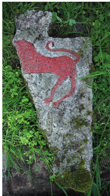
Рис. 3. Обломок вертикальной стелы надмогильного комплекса № 4 кладбища Местте.

Поперечный разрез корпуса горизонтального надгробия дает силуэт возвышенного полуцилиндра, за исключением двух участков, где спинке корпуса придана прямоугольная форма.