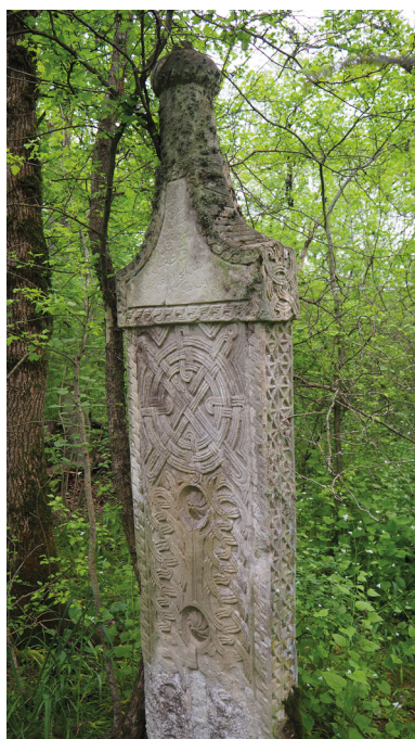
Рис. 13. Вертикальная стела антропоморфной формы 1795/96 г.

ного переплетения из трехленточных элементов. В центре верхней части памятника изображена розетка.