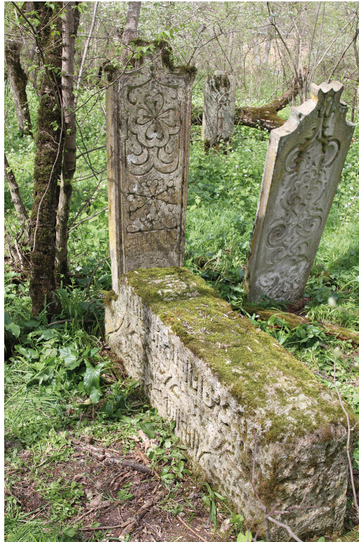
Рис. 11. Погребальный комплекс, состоящий из горизонтального надгробия и соединенной с ней вертикальной стелы.

Погребальный комплекс, состоящий из горизонтального надгробия и соединенной с ней вертикальной стелы (рис. 11). У изголовья горизонтального надгробия выемкой обнаружен паз, куда вставлена горизонтальная стела. Паз сделан в заниженной на 20 см части спинки саркофагообразного надгробия. Обе составные части изготовлены из ракушечника.