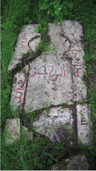
Рис. 5. Вертикальная стела надмогильного комплекса № 5 кладбища Местте.

Внутри поля читается выгравированное горизонтально слово «الرحمن» — Милостивый .