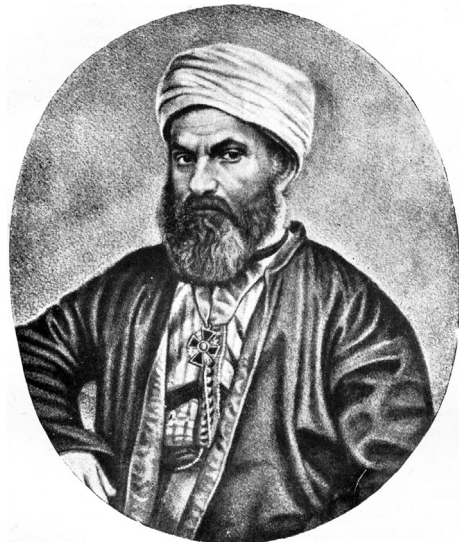
Шейх Тантави (1810–1861)

Востоковедение в Санкт-Петербурге и в России в целом на этапе его становления в XVIII–XIX вв. было широко представлено именами известных ученых — уроженцев Европы и Востока. Особое место среди них принадлежало выходцам с Ближнего Востока, среди которых, конечно, вновь следует вспомнить имя Мирзы Казембека (1802–1870), «родом персиянина, в мусульманстве — Мухаммада Али», в христианстве — Александра Константиновича, ставшего первым деканом созданного в 1855 г. факультета восточных языков (ФВЯ).