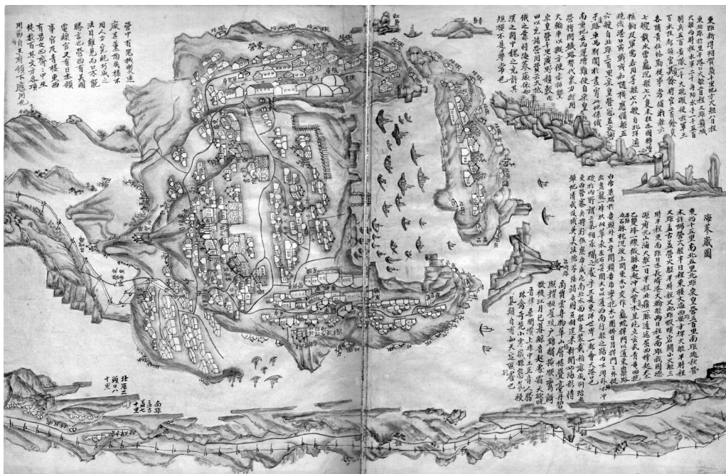
Рис. 1. Лист «Карты России» с изображением Владивостока [1]

«Военно-морские силы [насчитывают] 2000 [солдат], на судах военного флота — 1500 матросов; [имеются] 500 кавалеристов, 1000 стрелков, 300 артиллеристов. Один дулингуань 12 командует морскими и сухопутными силами, более 200 прочих высших офицеров, каждый со старанием и прилежностью исполняет свои обязанности... 6–7 боевых судов регулярного флота, 7–8 минных крейсеров 13 заходят [в порты] нашей страны [в Корею]. 7–8 вспомогательных судов, предназначенных под перевозку провианта, зерна и военного снаряжения, ходят повсюду, начиная от Бэйяна 14 , курсируют между российскими портами. [Есть еще] 5–6 судов, которые используются сообразно обстановке в военных и мирных [целях]» 15 (Карта России. Хайшеньвэй [1]).