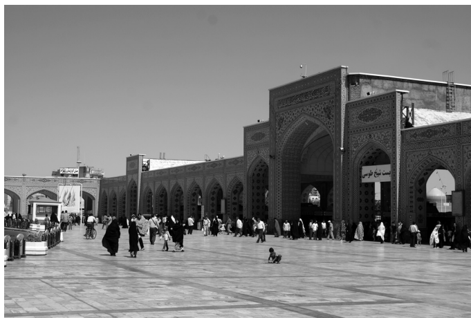
Рис. 3. Мешхед, площадь Сахна-йи джами'-йи Ризави перед Кудс-и Ризави (Харам-и Мутаххар) (фото А. К. Алексева).

располагаются молящиеся. Подготовка к молениям и уборка помещений выполняется специальными приписанными к комплексу работниками. На территории комплекса расположено большое количество хавуз ов и мест для совершения вузу' .