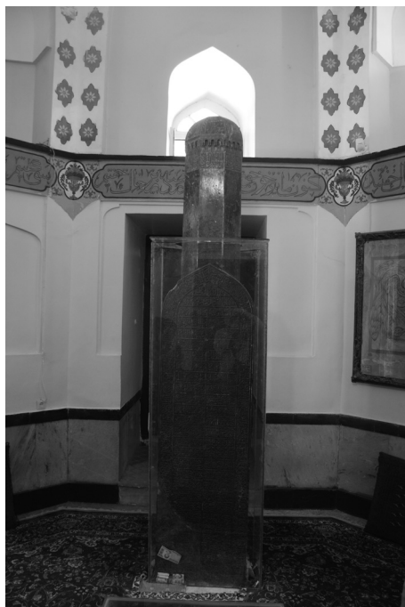
Рис. 7. Черная стела с мавзолея Фарид ад-Дина Атгара.

‘Атгара его посещение внешне не несет на себе атрибутов, присущих мусульманскому паломничеству 10 .