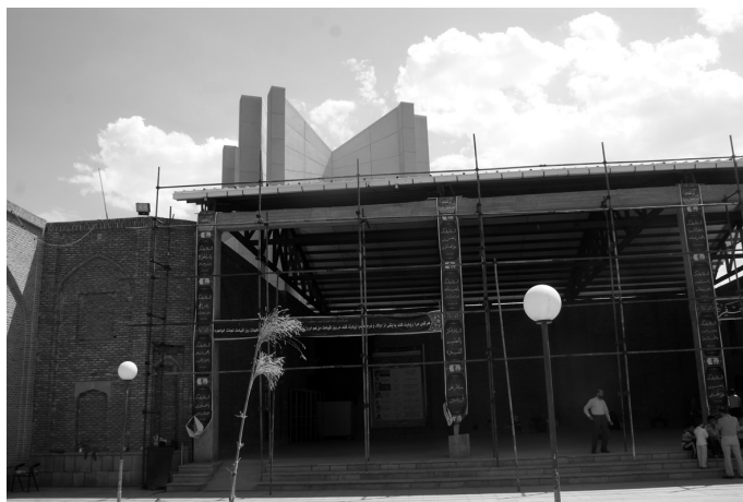
Рис. 1. Табриз, Бук'а-йи (Имамзада-йи) Саййад Хамза б. Джафар. На горизонтальном плакате знаменитый хадис Мухаммада: «Кто будет совершать паломничество (зийярат) ко мне или одному из моих потомков (авлад), того я навещу в День Страшного суда (Руз-и киййамат) и спасу его в День Страшного суда».

и 200-часовую программы, в рамках которых разбираются практические и теоретические вопросы, связанные с хаджжем и 'умрой (' umra ), изучаются арабский язык, история ислама, география Саудовской Аравии, Ирака и Сирии. Для управления паломничеством готовятся и специальные кадры на университетском уровне. Советом по планированию в области высшего образования ИРИ ( Shaura-yi barnamarizi-yi amuzish-i 'ali ) были одобрены две новые университетские специализации: «История и культура исламских народов» ( Tarikh wa tamaddun-i milal-i islami ) и «Пропаганда в области хаджжа и зийярата» ( Tabliḡ dar hajj wa ziyarat ).