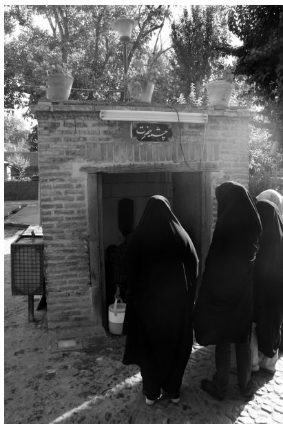
Рис 5. Источник у кадамгаха имама Ризы (Чаима-йи Хазрат).

тральной Азии. В год переселения имама якобы была засуха ( sal-i qaht ). Имам ударил в определенном месте своим посохом ( ‘asa ), и забил источник. Однако, по нашему мнению, источник с чистой водой ( ob-i shirin ) в условиях аридного засушливого климата в Хорасане пользовался почитанием задолго до ислама, что вполне укладывается в культ почитания сил природы.