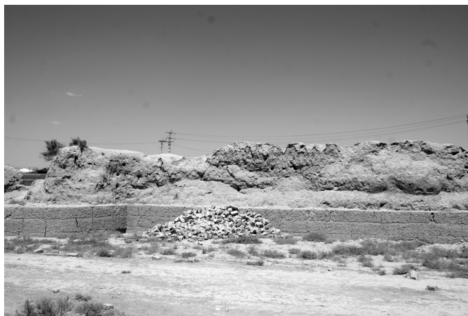
Рис. 2. Развалины древнего Туса.

что в условиях безработицы в Иране имеет большое значение [17, S. 11]. Подобная ситуация демонстрирует прямую зависимость развития города от места паломничества 7 .