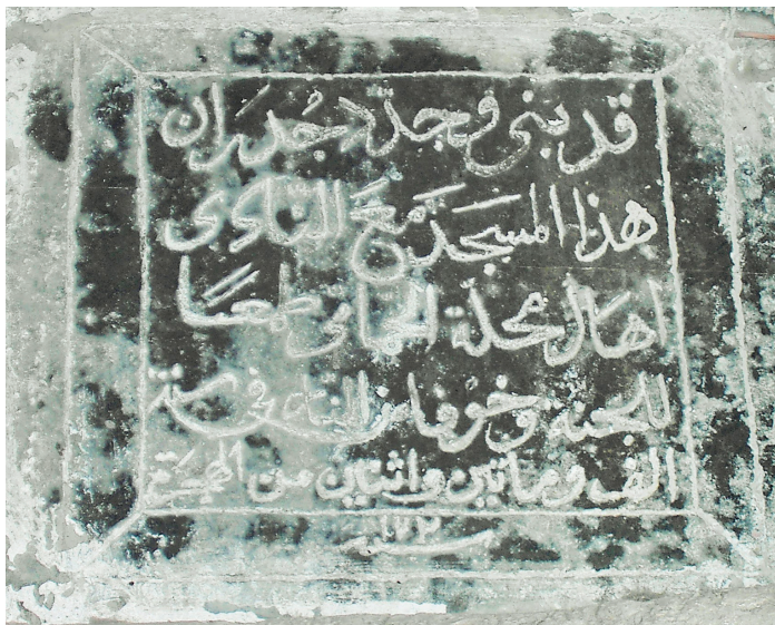
Рис. 15. Надпись 1787–1788 г. о ремонте квартальной мечети в селении Ахты.