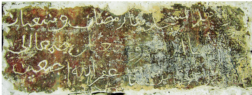
Рис. 11. Надпись XVII — первой половины XVIII в. из селения Ялак о строительстве мечети.