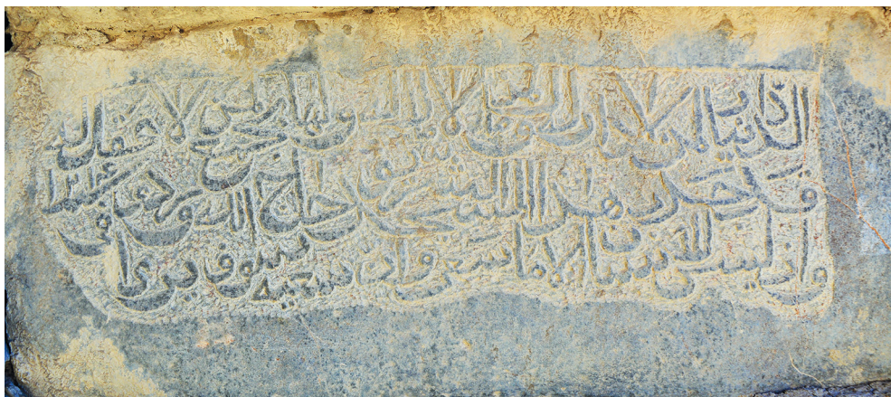
Рис. 16. Надпись о ремонте мечети селения Гдым в 1799–1800 г.

В фасадной стене Джума-мечети Гдыма установлена плита 50×20 см (рис. 16). Рельефный текст из трех строк нанесен техникой изъятия окружающего фона плотным почерком наسخ . Надпись оканчивается аятами Корана из суры «Звезда» (53:39–40).