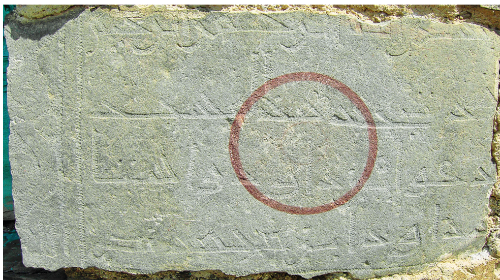
Рис. 4. Куфическая надпись о ремонте мечети. XIII–XIV вв.