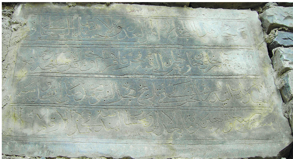
Рис. 13. Строительно-историческая надпись от 1782–1783 г. из селения Смугул.