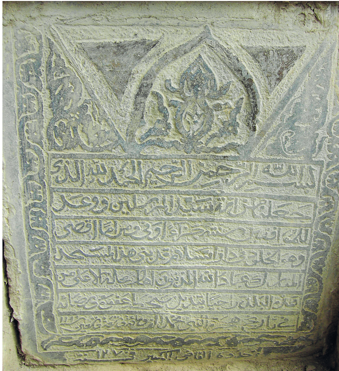
Рис. 14. Надпись о строительстве в 1784–1785 г. квартальной мечети в селении Ахты.