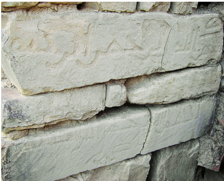
Рис. 6. Куфические надписи XI–XII вв. из селения Луткун.

панно опорных баз колонн в мечети Каракюре датируются X в. [2, с. 96–114], а великолепный штукатурный михраб мечети Калакорейша — XII–XIII в. [2, с. 138–145; 13, с. 36–38]. Имеются сведения о существовавшем прежде штукатурном михрабе в селении Мискинджа 10 [14, с. 64]. Кроме Дагестана, в других регионах России штукатурные рельефы не обнаружены.