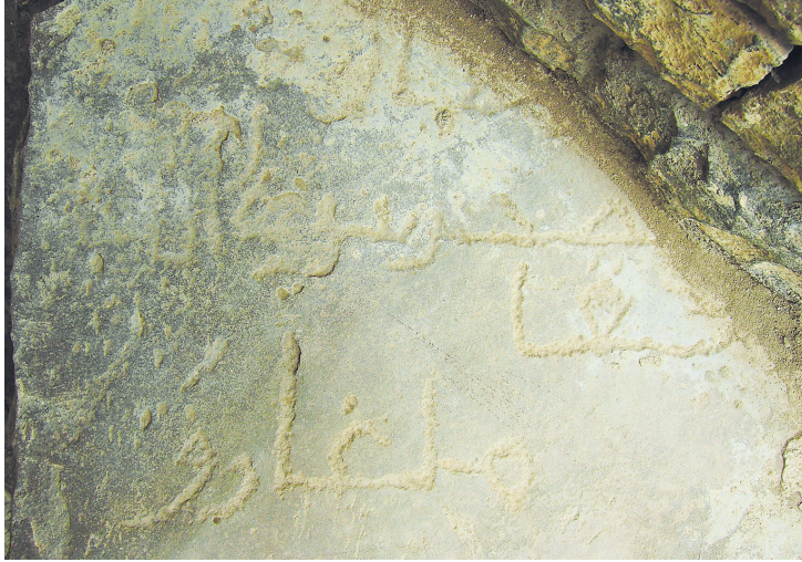
Рис. 8. Фрагмент куфической надписи XII–XIII вв.

В левом углу внешнего постамента михраба , на горизонтально установленной плите сохранился фрагмент врезной куфической надписи (рис. 8). Надпись повреждена.