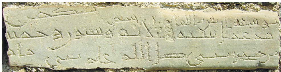
Рис. 1. Куфическая надпись от 1167–1168 г. из селения Зрых.

В надписи имеются орфографические ошибки. Куфический стиль надписи почти лишен диакритики. Лишь одно слово снабжено точками — числительное «три» (ثلاثة), где точки проставлены дважды над буквами <ث>, а та-марбута их не имеет. Складывается впечатление, что эти точки были проставлены позже, поскольку остальные слова точек не имеют.