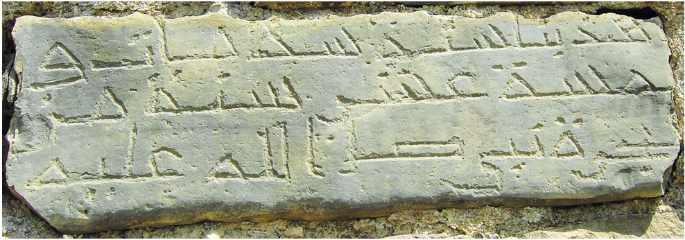
Рис. 2. Куфическая надпись от 1218–1219 г.

Слово «год» (سنة) в надписи начертано дважды — в первой и второй строках. Как и в куфическом тексте от 1167/68 г., нет конкретного указания на объект строительства. Скорее всего, речь в надписи идет о возведении мусульманского культового сооружения — мечети, минарета, мадраса или суфийской обители 5 , поскольку подавляющее большинство строительных куфических надписей Дагестана повествует о сооружении построек религиозного назначения.