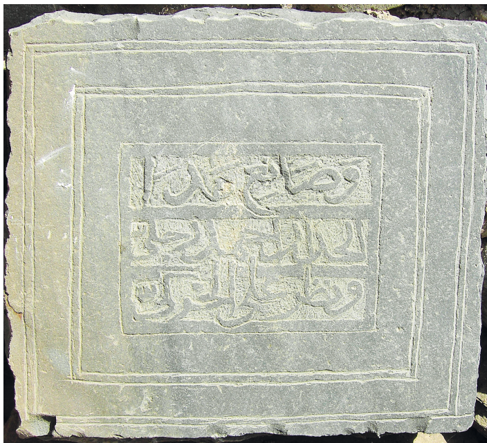
Рис. 5. Надпись XVII в. о строительстве стены.

ти, составленная, предположительно, во второй половине XVII в. В числе мастеров, построивших мечеть, надпись называет Ахмада из Рича. Зрыхскую надпись мы также датируем второй половиной XVII в., что согласуется как со стилем письма, так и с характерной для этого времени манерой оформления плиты.