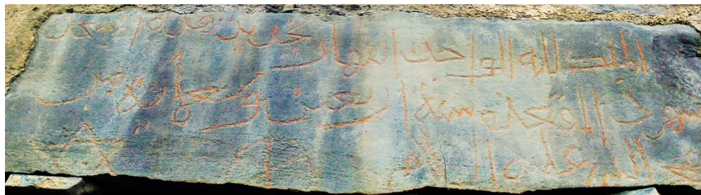
Рис. 9. Надпись 1534 г. из селения Маза о ремонте мечети.

около 2000 м над уровнем моря. Селение, имеющее многовековую историю, покинуто жителями и находится в развалинах. О некоторых страницах средневековой истории Маза повествуется в арабоязычном историческом сочинении, известном как Та'рих Маза [25, с. 109–140]. Кроме того, Маза упоминается в дагестанском историческом сочинении 1456 г. Махмуда ал-Хиналуки [26, с. 49, 51, 54].