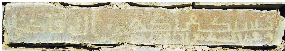
Рис. 7. Куфическая надпись XII–XIII вв. Отрывок из Корана.

Над аркой западной стены Джума-мечети вмонтирован вытянутый камень 86 × 11 см (рис. 7). На нем врезана куфическая надпись — отрывок из коранического айата суры «Корова» (2:137):