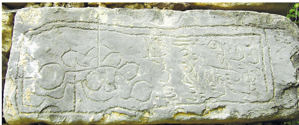
Рис. 10. Строительная надпись XV–XVI вв. из селения Кака.