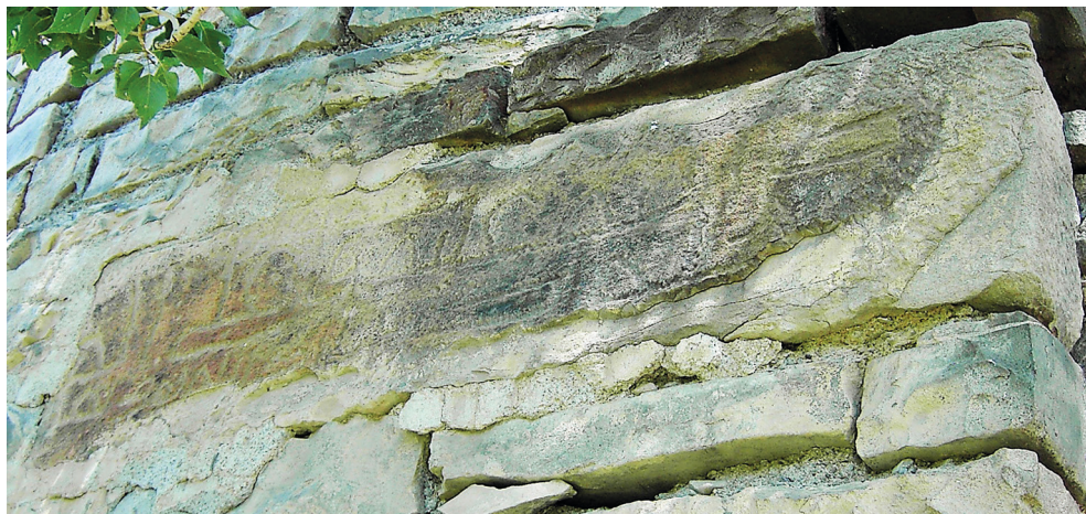
Рис. 3. Куфическая надпись XII–XIII вв.