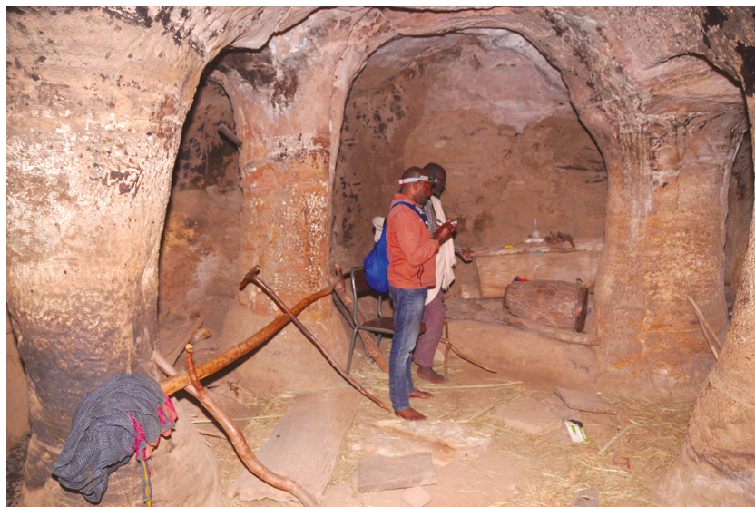
Рис. 1. Интерьер скального храма Микаэль Адди Кауа (вид на северо-восток).

В кыддысте вырезаны три пары циркульных в сечении столбов, образующих два ряда. Обхват некоторых достигает 1,5 м. Они не имеют выраженных капителей, но их основания обозначены расширением наподобие баз. Интервал ароч-