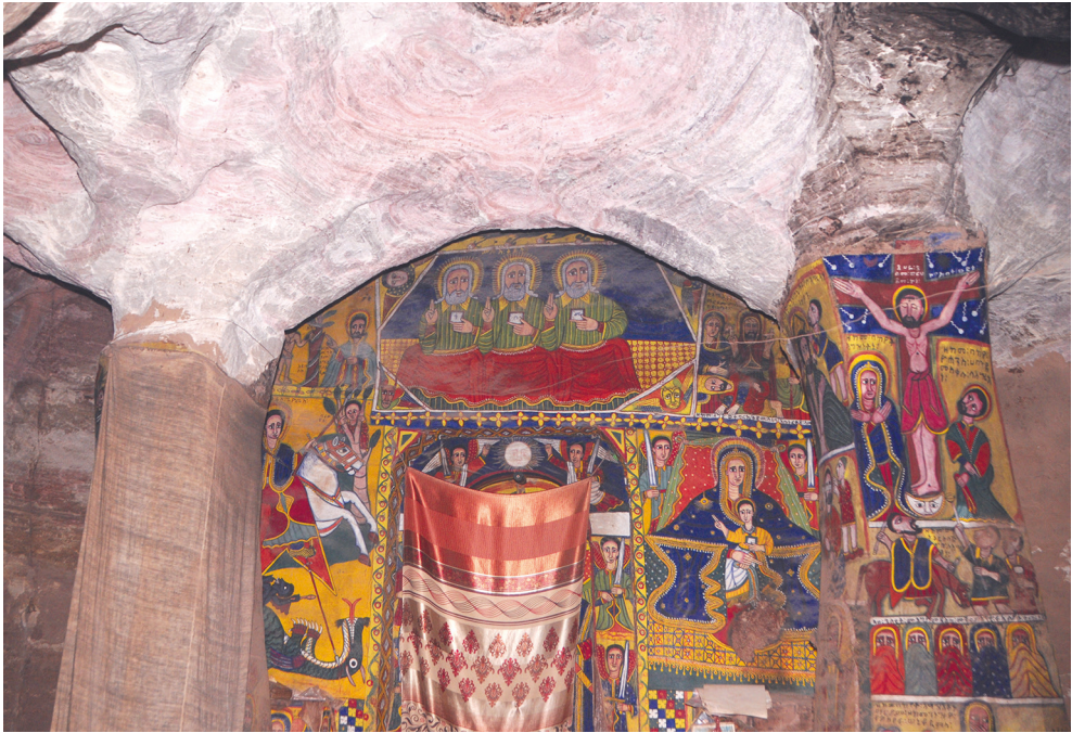
Рис. 5. Фрагмент интерьера скального храма Абунэ Фэкадэ Амлак в Адди Цырэ (вид на восток). Фото С. Клюева, 2019

ном храме Абунэ Гэбрэ Микаэль в Квыраро (возможно, XV в.) в районе Гэралъта [17, р. 316–318] и, более отдаленно, в расположенном по соседству храме Марьям Хыбыито. Архивольт западной арки центрального нефа и его импосты представляют собой единый, обозначенный характерной формой объем. Такие формы находят сходство, в частности, с храмом Абунэ Йыма'ата Гвых (Abunä Yēm'ata Gwəḥ) [4, р. 136], который можно датировать предположительно концом XV — началом XVI в. [18, р. 940–941]. Храмы Квыраро и Гвых расположены в 16 и 27 км к северо-востоку соответственно.