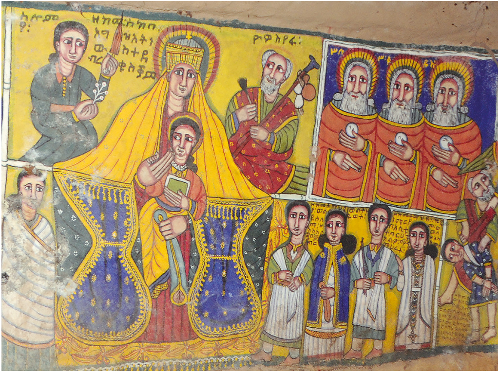
Рис. 9. Фрагмент росписи по холсту северо-западной стены кыддыста скального храма Марьям Деголчако. Фото С. Ключева, 2019

Факт обретения нового статуса däbr надо проверять по другим источникам. Однако здесь дано полное название церкви — Дэбрэ Сэлам Марьям Дэгултако.