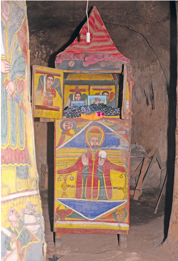
Рис. 8. Мэнбэрэ-табот в интерьере мэкдэса скального храма Марьям Деголчако.

и мэнбэрэ-табота (рис. 9). По европейскому летоисчислению это 1963–1964 гг., если точная дата написания позже 22 числа четвертого эфиопского месяца тахсас.