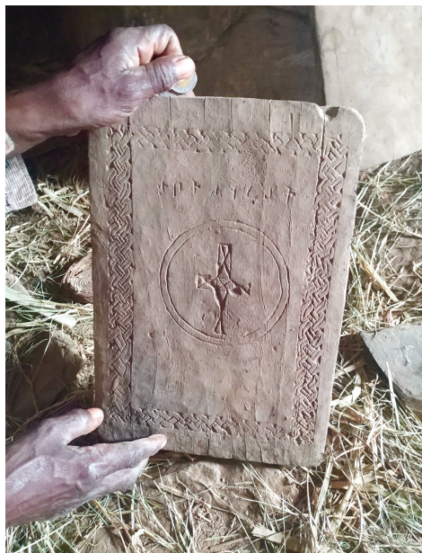
Рис. 2. Один из таботов, обнаруженных в храме Микаэль Адди Кауа.

В пространстве храма авторами статьи были обнаружены в настоящее время неиспользуемые деревянные пластины таботов 9 (их средние размеры 30 × 22 см) (рис. 2). На двух из них можно прочесть посвящение: Хауриат (Апостолы) и Микаэль-Габриэль (Архангелы). Еще один табот не имеет надписей, он декорирован вырезанным по центру лапчатым крестом в круге, между рукавами которого образован четырехлистник, выходящий за пределы круга. Такой табот, возможно, посвящен Христу. Определить стилистически датировку орнаментов на таботах затруднительно. Можно предположить, что наличие трех таботов говорит о некогда трехалтарности храма, а возможно, и трехчастности мэкдэса. Впрочем, более вероятно использование всех трех таботов на одной базе поочередно. В любом случае сам этот факт может свидетельствовать о более частом использовании храма ранее, чем в наши дни 10 .