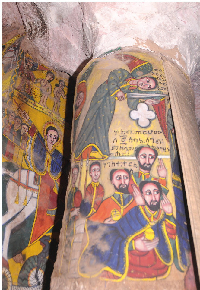
Рис. 6. Фрагмент росписи в интерьере Абунэ Фэкадэ Амлак в Адди Цырэ. Верхняя часть северной стороны северо-восточного столба.

и татуировками на шее. Дальше по кругу столба представлены двое мужчин в военной форме, аналогичной описанной выше. Молодой стоит с ружьем, старший нарисован сидящим и одет в белую накидку, в руке у него метелочка-мухогонка (рис. 7).