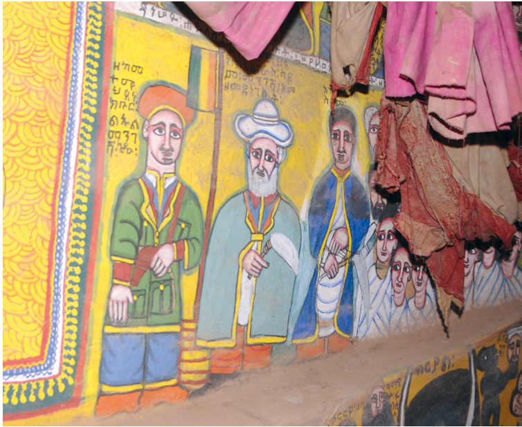
Рис. 11. Фрагмент росписи внешней стороны юго-западной стены мекдэса в храме Марьям Деголчако.

Рас Сыййум Мэнгэша известен своим противостоянием Хайле Селласие в частности и шоанской власти Аддис-Абебы в целом. Помимо этого, он является внуком эфиопского царя Иоанна IV (годы правления 1872–1889). Он активно участвовал в междоусобных конфликтах собственно тыграйских феодалов. В 1896/97 г. Сыййум Мэнгэша управлял Тэмбеном и Абэргэлле. В 1914 г. он получил титул раса и вместе с ним в управление Тыграй [26, р. 646]. Рас Тэфэри, будущий император Хайле Селласие I, не доверял расу Сыййум Мэнгэша, как и другим наместникам тыграйских земель. Его недоверие и политика лавирования между разными политическими элитами в Тыграе выразились в титулатуре. Обратим внимание на титулы, использованные в надписях. Они оказались в обороте только в XIX–XX вв.