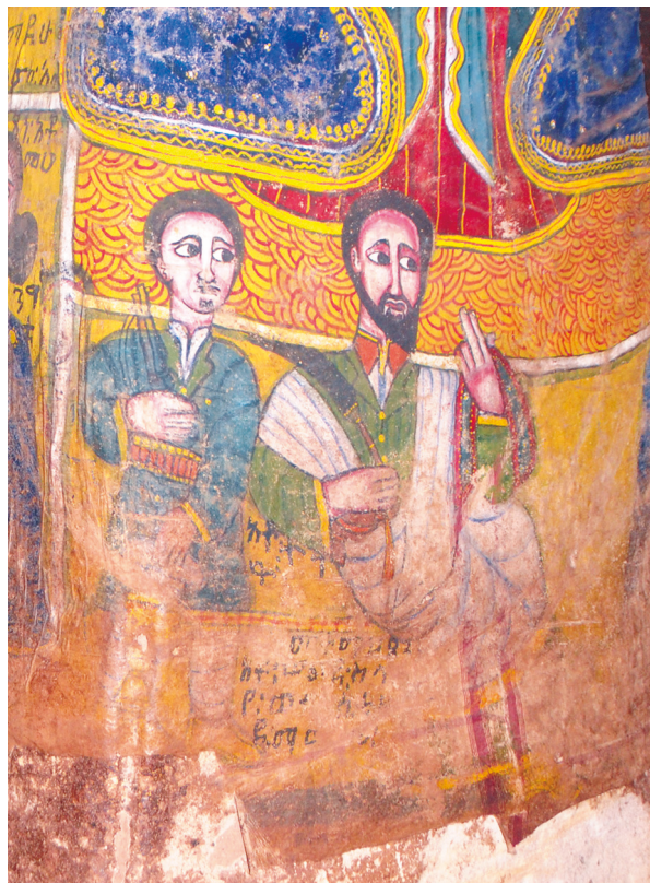
Рис. 7. Фрагмент росписи в интерьере Абунэ Фэкадэ Амлак в Адди Цырэ. Нижняя часть южной стороны северо-западного столба. Фото С. Ключева, 2019

Действительно, на значительном расстоянии напротив сидящего мужчины написана женщина в синей накидке и белом платке, оставляющем незакрытым только лицо.