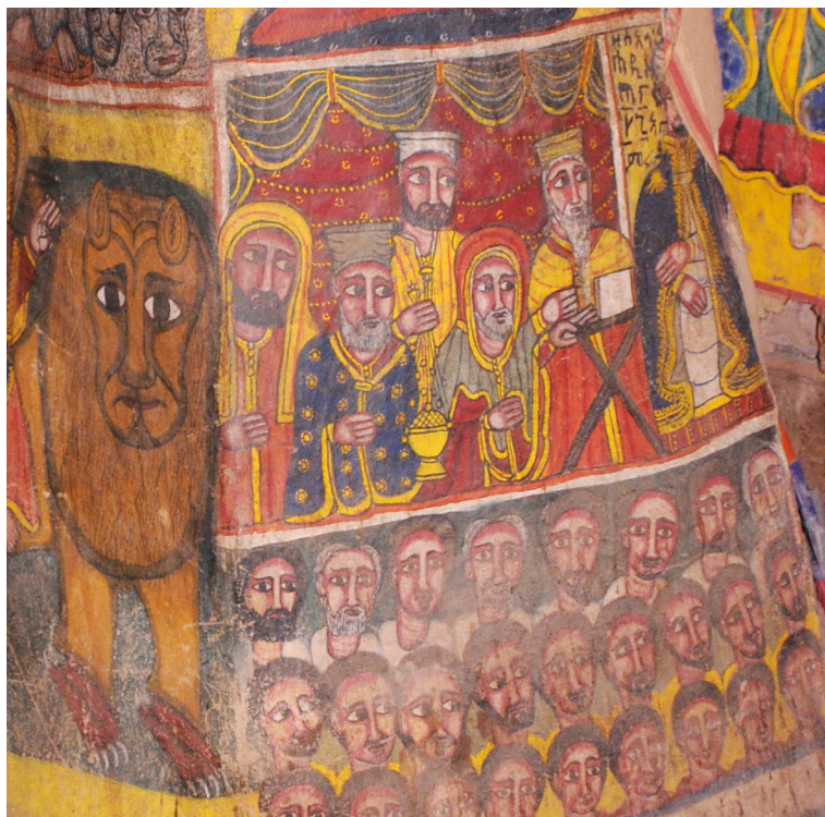
Рис. 4. Фрагмент росписи в интерьере Абунэ Фэкадэ Амлак в Адди Цырэ. Нижняя часть южной стороны северо-восточного столба. Фото С. Клюева, 2019

вые два слова — «тот, который рисовал, (...) и Хаддис». Вероятно, Хаддис — имя художника, не заказчика, которое также может упоминаться в надписях такого рода. Дальше /ṭāna/ может быть частью слова /zä ṭāna/, что означает 90, а может быть частью имени, любого другого слова. Первый слог /ʾa/ — начало слова /ʾamätä/ 'год', как и начало слова /mə/ — /məhrät/ 'милости'. Год милости — стандартное обозначение эфиопского летоисчисления на письме и в речи. Из написания года видны две цифры — 57. Скорее всего, здесь та же ситуация, что и с надписью выше — год 7457 от сотворения мира. Если смотреть по стилю, то все холсты писались в одно время, может, плюс-минус год, что маловероятно. Это видно из иконографической программы и художественного исполнения. Вопросы стиля будут подробнее рассмотрены ниже.